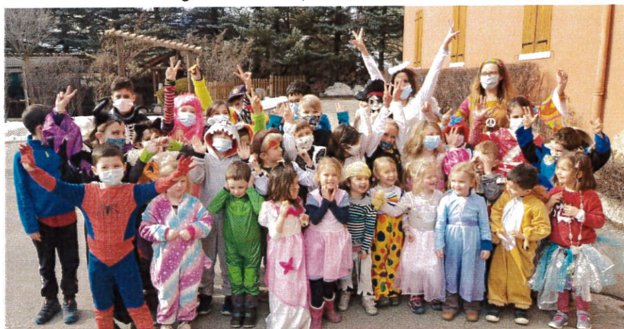
Un joyeux carnaval à l'école !