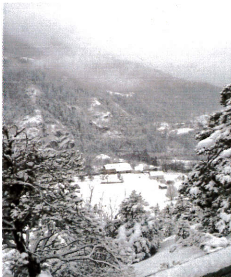
La Fresquière sous la neige

Si vous aussi souhaitez partager des informations, n'hésitez pas à nous proposer vos textes !