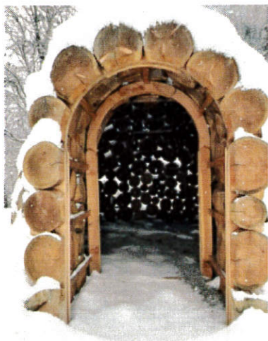
Igloo créé à la Maison du Bois en 2020