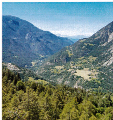
Vue sur les champs de Chaudon

La médiathèque expose du 5/10 au 23/01 des photographies : "60 ans de mise en eau du lac de Serre-Ponçon"