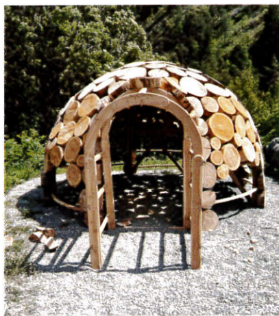
Igloo à la Maison du Bois