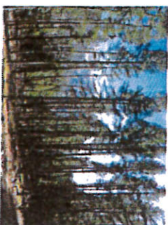
Mélèzes après coupe d'éclaircie

Pour une visite diagnostic gratuite de vos parcelles, n'hésitez pas à contacter le technicien du CNPF.