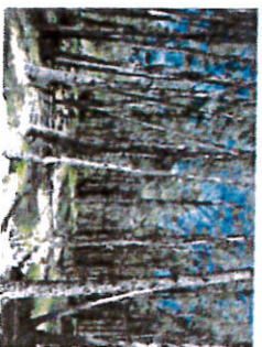
Boisement classique de pin sylvestre