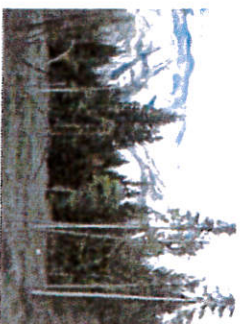
Opération à éviter: exemple de parcelle surexploitée: